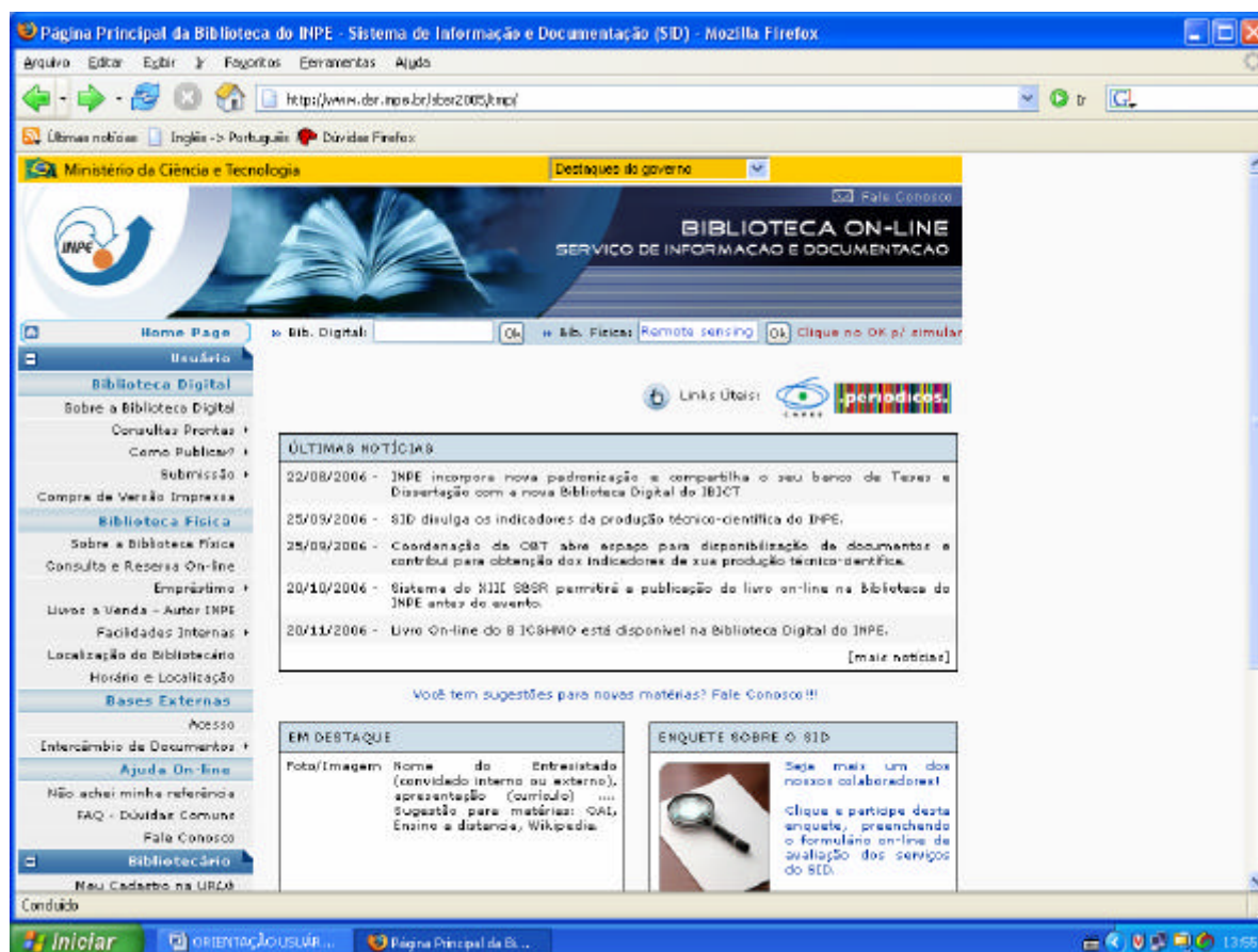
Figura 1 - Portal do SID.

Para publicar na Instituição encontra-se no Portal do SID, informações a respeito de normalização, submissão e de como submeter uma publicação na Biblioteca Digital da Memória Técnico-Científica do INPE. Algumas destas facilidades estão descritas neste guia. Detalhes de como publicar, encontram-se no Manual para Elaboração, Formatação e Submissão de Teses, Dissertações e Outros Trabalhos do INPE , disponível no Portal do SID: http://www.inpe.br/biblioteca , conforme Figura 1. Na home page acessar o link Usuário/Como Publicar, conforme Figura 2 e selecionar o editor: Word, Latex, ou BrOffice.org.