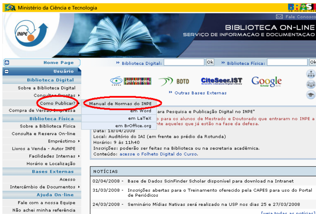
Figura 2 – Portal Biblioteca On-line, Como Publicar? Manual de Normas do INPE.

No Portal, cada editor tem uma página diferenciada, onde encontram-se links para o manual, para o estilo elaborado naquele editor e outras informações. Veja Figura 3.