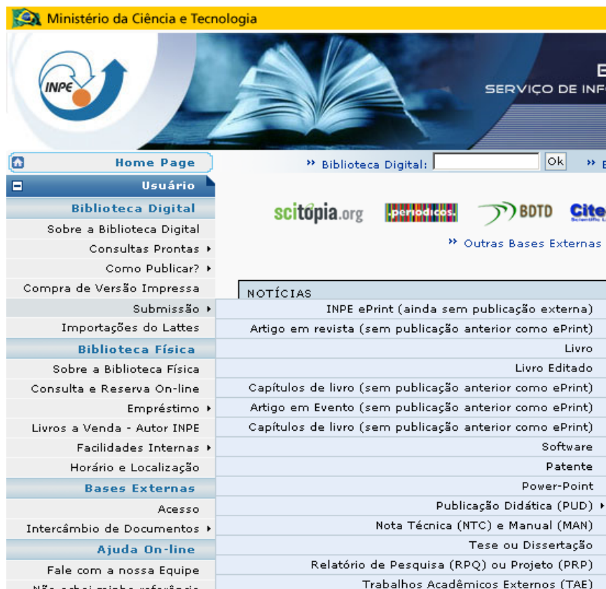
Figura 6 - Submissão de publicações no INPE na página Biblioteca On-line