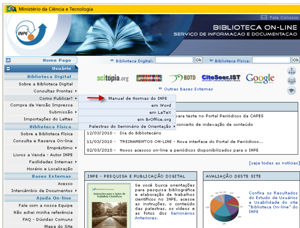
Figura 2 – Página Biblioteca On-line , Como Publicar? Manual de Normas do INPE.

No site, cada editor tem uma página diferenciada, onde se encontram links para o manual, para o estilo elaborado naquele editor e outras informações. Veja Figura 3.