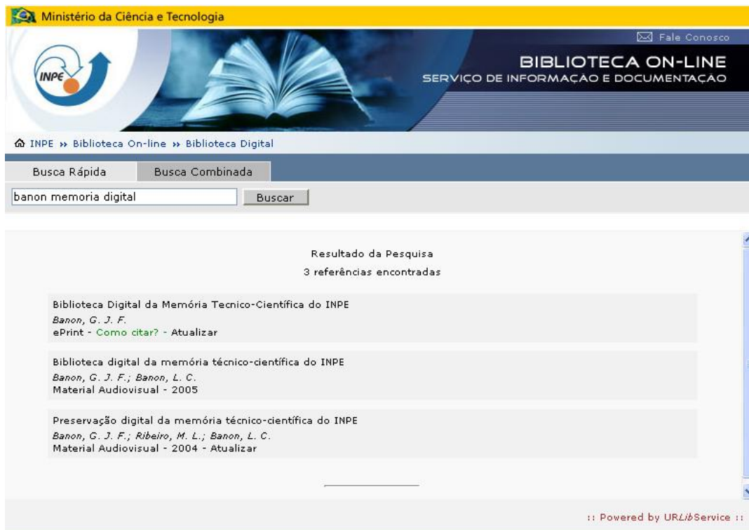
Figura 4 – Página Biblioteca On-line / Biblioteca Digital da Memória Científica.

O acesso à Biblioteca Digital (BD) pode ser feito pela página do SID. A BD oferece os seguintes serviços entre outros: