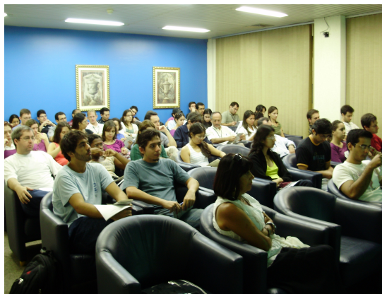
Auditório Roger Honiat, junho de 2009

O seminário que será realizado agora no dia 23 de setembro de 2009, apresentará algumas mudanças de formatação que têm como objetivo facilitar na preparação das teses e dissertações.