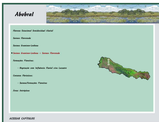
Figura 3: Sub-região do Abobral com pontos assinalados, os quais são links para fotos, da sub-formação composta de Savana Gramíneo Lenhosa + Savana Florestada.

Na figura 3 observa-se a página da mesma Sub-região do Abobral com os temas de vegetação que são exemplificados por fotos, mostrando ainda os pontos localizados na imagem de satélite os quais são acessos às fotos. Nesta figura pode ser observado que a sub-região do Abobral está representada pelas sub-formações de vegetação: Floresta Estacional Semidecidual Aluvial, Savana Florestada, Savana Gramíneo-Lenhosa, Savana Gramíneo-Lenhosa + Savana Florestada, Formações Pioneiras (Vegetação com influência fluvial e/ou lacustre), Contatos Florísticos (Savana + Formações Pioneiras) e Áreas Antrópicas (Pecuária).