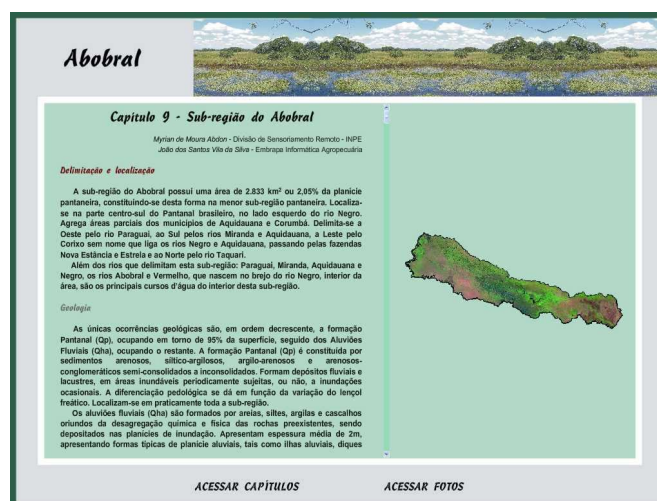
Figura 2: Página do Capítulo 9 - Sub-região do Abobral

Cada capítulo traz informações específicas sobre a sub-região que está sendo consultada. As informações versam sobre delimitação e localização, geologia, geomorfologia, vegetação, solo e sistema produtivo. Na figura 2 encontra-se exemplificada a página correspondente ao Capítulo 9 da Sub-região do Abobral, cujo texto é transcrito a seguir.