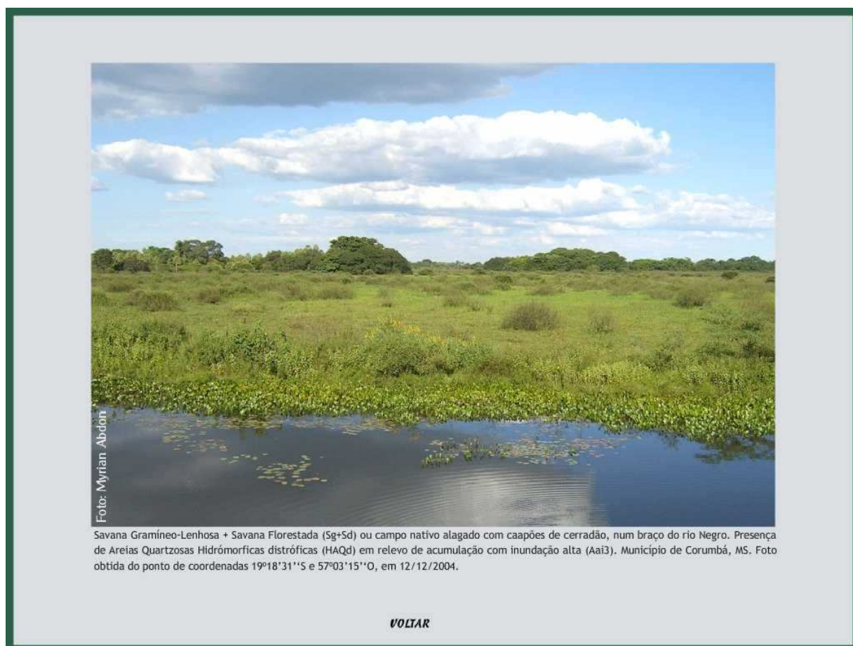
Figura 4: Fotografia obtida na sub-região do Abobral em área ocupada por campo nativo alagado com caapões de cerradão, no brejo do rio Negro.