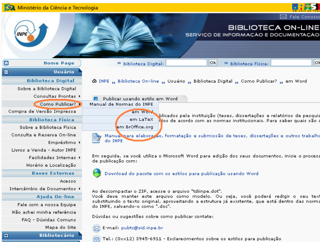
Figura 3 – Página Biblioteca On-line , link “Como publicar?” estilos.

No site, cada editor tem uma página diferenciada, onde se encontram links para o manual, para o estilo elaborado naquele editor e outras informações. Veja Figura 3.