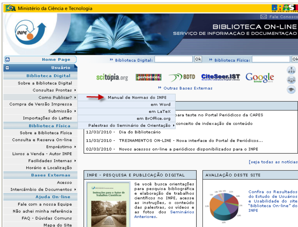
Figura 2 – Página Biblioteca On-line , Como Publicar? Manual de Normas do INPE.

No site, cada editor tem uma página diferenciada, onde se encontram links para o manual, para o estilo elaborado naquele editor e outras informações. Veja Figura 3.