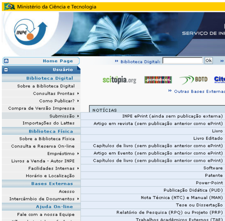
Figura 6 - Submissão de publicações no INPE na página Biblioteca On-line

O SID, atualmente, oferece um sistema interno de auto-arquivamento (recurso para submissão do documento completo pelo próprio autor). Esta opção está disponível no item "Submissão" no menu da Biblioteca Digital ( http://www.inpe.br/biblioteca ), no qual o usuário pode a qualquer momento, registrar a sua produção através de formulários internos (disponíveis por categorias de documento) conforme mostra a Figura 6.