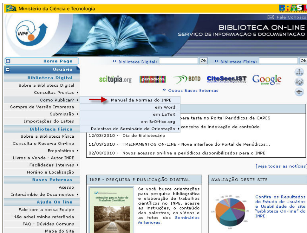
Figura 2 – Página Biblioteca On-line , Como Publicar? Manual de Normas do INPE.

No site, cada editor tem uma página diferenciada, onde se encontram links para o manual, para o estilo elaborado naquele editor e outras informações. Veja Figura 3.