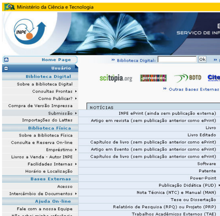
Figura 6 - Submissão de publicações no INPE na página Biblioteca On-line

O SID, atualmente, oferece um sistema interno de auto-arquivamento (recurso para submissão do documento completo pelo próprio autor). Esta opção está disponível no item "Submissão" no menu da Biblioteca Digital ( http://www.inpe.br/biblioteca ), no qual o usuário pode a qualquer momento, registrar a sua produção através de formulários internos (disponíveis por categorias de documento) conforme mostra a Figura 6.