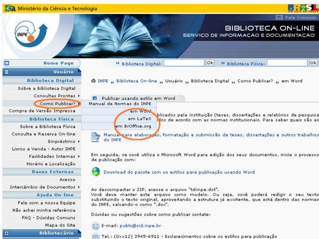
Figura 3 – Página Biblioteca On-line , link “Como publicar?” estilos.

No site, cada editor tem uma página diferenciada, onde se encontram links para o manual, para o estilo elaborado naquele editor e outras informações. Veja Figura 3.