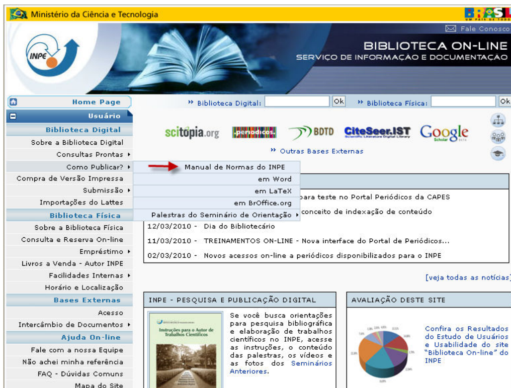
Figura 2 – Página Biblioteca On-line , Como Publicar? Manual de Normas do INPE.

No site, cada editor tem uma página diferenciada, onde se encontram links para o manual, para o estilo elaborado naquele editor e outras informações. Veja Figura 3.