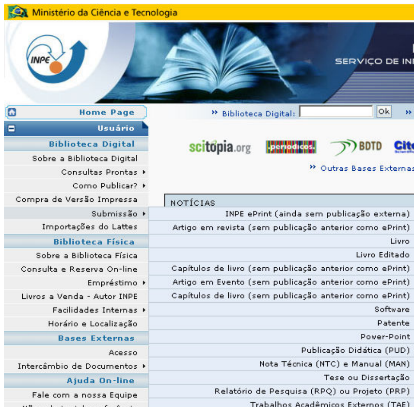
Figura 6 - Submissão de publicações no INPE na página Biblioteca On-line

O SID, atualmente, oferece um sistema interno de auto-arquivamento (recurso para submissão do documento completo pelo próprio autor). Esta opção está disponível no item "Submissão" no menu da Biblioteca Digital ( http://www.inpe.br/biblioteca ), no qual o usuário pode a qualquer momento, registrar a sua produção através de formulários internos (disponíveis por categorias de documento) conforme mostra a Figura 6.