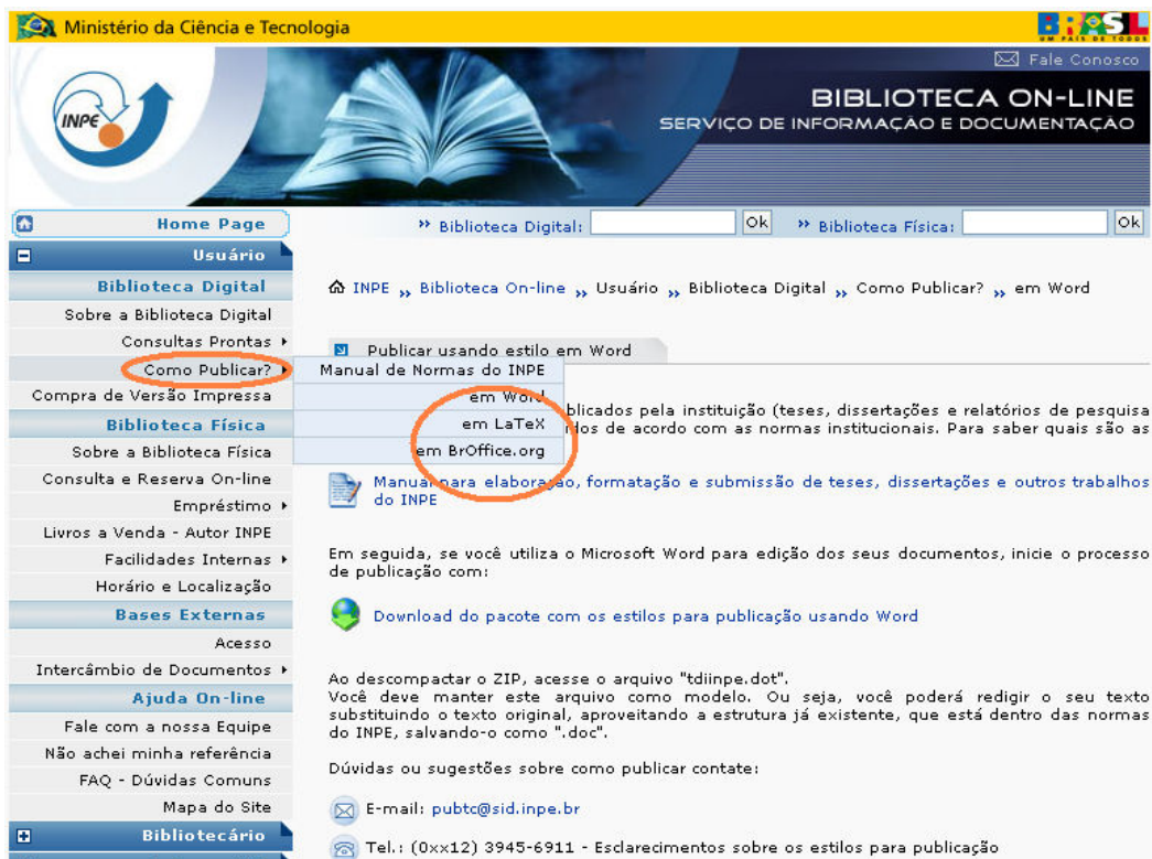
Figura 3 – Página Biblioteca On-line , link “Como publicar?” estilos.

No site, cada editor tem uma página diferenciada, onde se encontram links para o manual, para o estilo elaborado naquele editor e outras informações. Veja Figura 3.