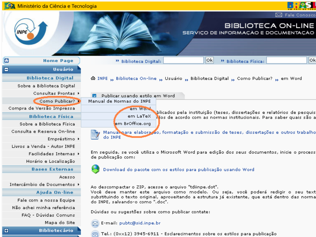
Figura 3 - Portal Biblioteca On-line, link “Como publicar?” estilos.

No Portal, cada editor tem uma página diferenciada, onde encontram-se links para o manual, para o estilo elaborado naquele editor e outras informações. Veja Figura 3.