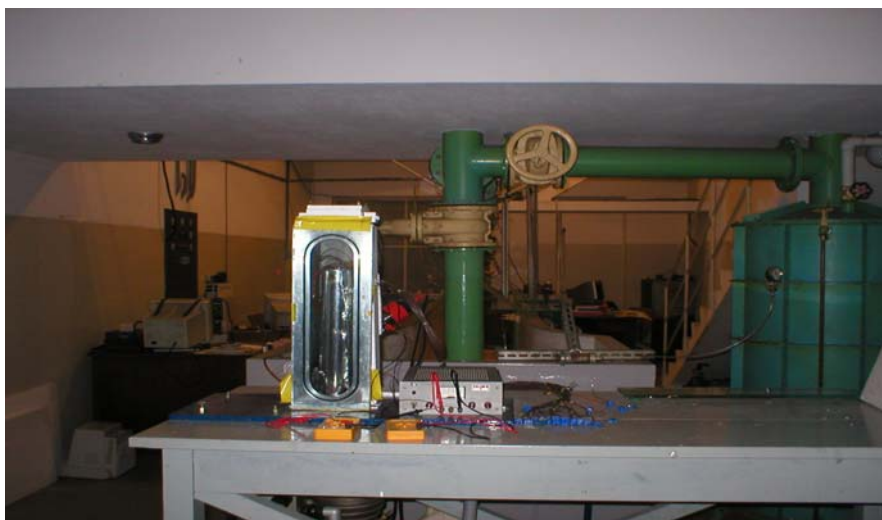
Figura 3. Vista geral do aparato experimental.

Figura 3 apresenta uma vista geral do aparato experimental: sobre a bancada de teste, à esquerda, está a câmara de alto vácuo, do lado direito a esta da câmara, está a fonte de alimentação de energia elétrica do aquecedor de película (“ skin heater ”), e os termopares a serem conectados ao medidor de temperatura. À frente estão os dois multímetros utilizados na medição da voltagem e a corrente para a alimentação do aquecedor de película (imposição da taxa de calor).