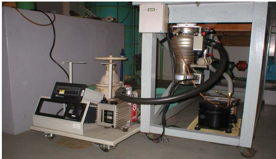
Figura 4. Sistema de bombeamento e medição de vácuo e o sumidouro de calor da câmara.