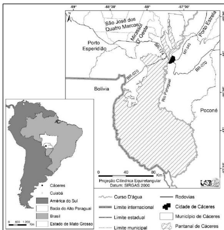
Figura 1. Esquema de localização do Pantanal de Cáceres /MT.

O Pantanal de Cáceres é uma das sub-regiões do Pantanal Mato-grossense, que corresponde a aproximadamente 9,01% de sua área territorial (Silva; Abdon, 1998), ocupando 50,87% da área territorial do município de Cáceres (Neves et al., 2008), está localizado na Bacia do Alto Paraguai (BAP) na região sudoeste de planejamento do estado de Mato Grosso (Figura 1). O bioma está dividido em onze sub-regiões. Dessas, as que compõem o estado de Mato Grosso são: Pantanal de Barão de Melgaço, Pantanal de Poconé e o Pantanal de Cáceres (Silva; Abdon, 1998). Situa-se desde a fazenda Barra do Ixu, na margem direita do rio Paraguai, no município de Cáceres, até a ilha do Caracará, no município de Corumbá/MS; limita-se a oeste com a fronteira da República da Bolívia e, a leste, com o Pantanal de Poconé, no município de Poconé (Neves et al., 2009). A área estimada do Pantanal de Cáceres é de 12.412,56 km 2 , dos quais 12.371 km 2 (99,66%) estão situados no município de Cáceres, 4,48 Km 2 (0,04%) no município de Curvelândia e 37,08 Km 2 (0,3%) no município de Lambari D'Oeste (Neves et al., 2006).