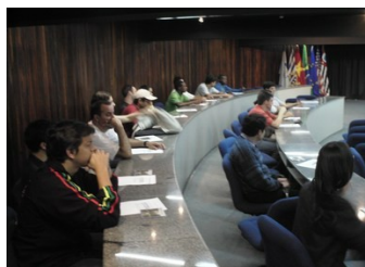
Seminário de 2008. Auditório do IAI

A partir de 2008, o seminário passou a ser denominado Orientação para Pesquisa e Publicação Digital no INPE. Este ano, o SID pretende disponibilizar um tutorial com o mesmo conteúdo do seminário com o objetivo de atender a mais autores ao mesmo tempo e facilitar o acesso ao seu conteúdo.