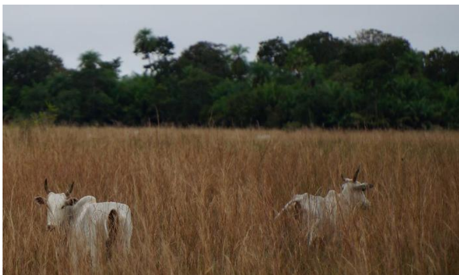
Figura 4. Pastagem nativa de capim-vermelho e cordilheira com cerrado ao fundo

Num estudo de diferenciação das lagoas, entre salinas e baías, Mourão et al. (1988) observaram que as salinas se apresentam com uma faixa arenosa no seu entorno, a qual é facilmente notada nos dados obtidos por imagens de satélites de média e alta resolução espacial, no período de seca. Na época de cheia, essas salinas se apresentam com sua faixa de cerradão ou mata bem próxima à lâmina de água. Nas baías, a vegetação observada em seu entorno pode ser cerradão, cerrado, e ocorrem faixas de campo entre a baía e a vegetação mais densa.