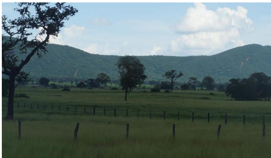
Figura 3. Áreas antrópicas nas proximidades da Serra de Maracaju

A vegetação ciliar, disposta no entorno dos cursos d'água e em locais úmidos e áreas de acumulações fluviais, ocupam apenas 1,48% no Pantanal da Nhecolândia e totaliza uma área de 39.904,38 ha. “Sua estrutura é diferente de uma floresta ciliar pois, além de vegetação arbórea denominada mata ciliar, com altura entre 10 e 17 metros, essa vegetação pode apresentar diferentes fisionomias, tais como campos gramíneos úmidos, vegetação arbustiva e flutuante, tornando o termo “vegetação ciliar” mais apropriado e abrangente, ao invés de Floresta Estacional Semidecidual Aluvial” (Silva et al.2011).